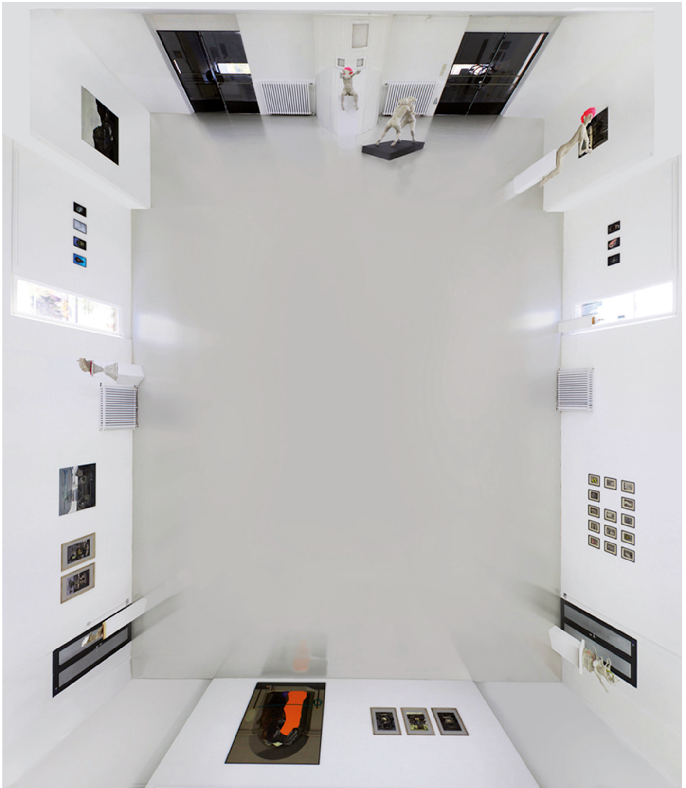
Ausstellungsraum - Aufsicht